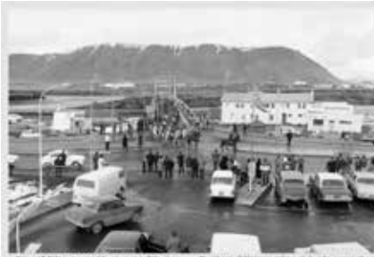
Hægræð Vilgasmanna í Kastamannahögnum Sveigir yfir Ölfvörðum 1972.