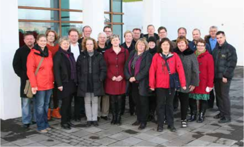
Starfsmenn héraðsskjalasafna safna framan við Héraðs- skjalasafnið á Akureyri.