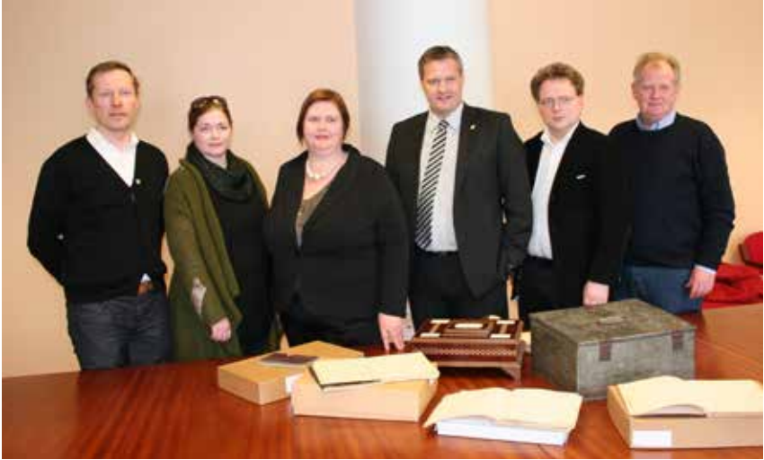
Á blaðamanna- fundi 18. apríl í húsaáskynnum Borgarskjalasafns Reykjavíkur þar sem átaki ÍSÍ og Félags héraðs- skjalavörða á Íslandi var hleypt af stokkunum.