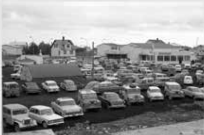
Stöðfesti Selfingsaga 1968. Frambrotastöð í Selfossi.