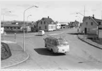
Tröngingur á síðasta dögum áttaátíundar 1980. Sveigir Kvaþfélaga Árneshöfna og Ska- Pæra og ríma VÍF stöð og Kvaþfélagið Hólfi á hægri.