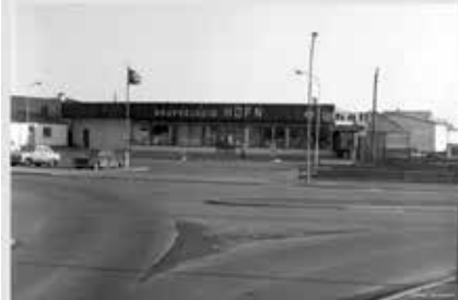
Kvaþfélagið Hólfi við brúarskipunina á Selfossi árið 1969.