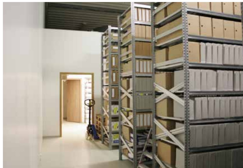
Skjalageymsla, skjalasetur héraðsskjalasafnsins að Háheiði. Í Háheiði eru er hægt að taka við um 500 hillumetrum af skjölum.

Langtímavarðveisla rafrænna skjala í stjórnsýslunni er enn skammt á veg komin, en umræður um fyrirkomulag, kostnað, tæknilegar útfærslur o.fl. verða sífellt fyrirferðameiri á fundum, málstofum og ráðstefnum skjalavarda og sýnist sitt hverjum. Aðgengi, áreiðanleiki, kostnaður, leitarbærni og skráning eru lykillugtök í allri áætlanagerð þegar horft er til langtímavarðveislur rafrænna gagna. Það verður að vera hægt að setja fram kostnaðargreiningu sem tekur bæði mið af kostnaði skjalamyndara við gerð vörsluútgáfa og þess kostnaðar sem fellur á vörsluaðila þegar kemur að því að viðhalda hinum rafrænu skrá. Aðgengi og leitarbærni í gagnagrunnum og öðrum rafrænum afhendingum lýtur öðrum reglum en leit og aðgengi að skjalasöfnum á pappír og þó svo að flest skjöl verði til á rafrænu formi er ekki þar með sagt að þau séu best geymd á því formi til langframa. Þurfa skjöl undirritunar við eða þarf að stimpla