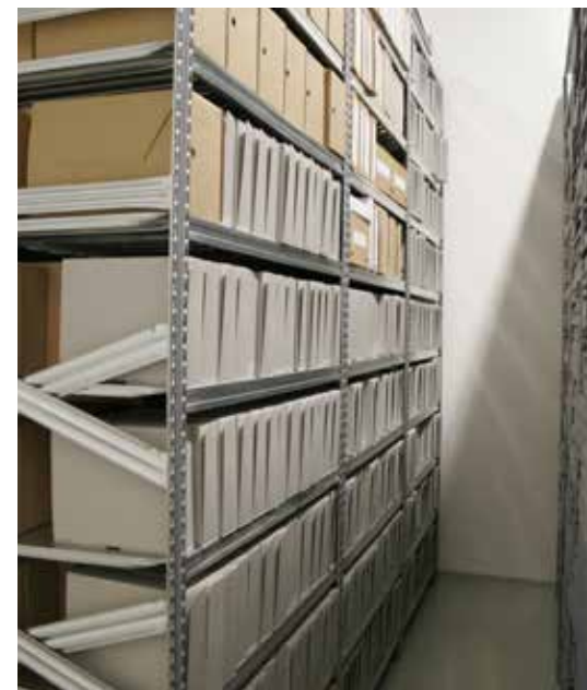
Móttaka, flokkun og skráning á stórum skjalafhendingum batnaði til muna þegar aðstaðan í Háheiði var tekin í notkun. Nú er hægt að taka á móti skjölum á vörubrettum og öll vinna við skráningu verður einfaldari og markvissari. Nú er jöfnum höndum tekið við afhendingum bæði á Austurvegi og í Háheiði.

Nú er búið að skrá skjöl frá 2005 til 2016 samkvæmt stöðlum. Opinber skjöl á þessu tímabili eru alls 250,69 og einkaskjalasöfn 199,55 hillumetrar, samtals 450,24 hillumetrar. Aðfanganúmer eru 971, 64 afhendingar þar fyrir utan hafa fengið aðfanganúmer 1010, 1011 o.s.frv. en þessar afhendingar rötudu ekki inn í aðfangabók á árunum fyrir 2009. Skipulega færð aðfangabók vönduð skjalaskráning og endurskráning eldri afhendinga er lykill að því að gera skjalasafnið betur aðgengilegt og þessari vinnu var og verður haldið áfram samhliða skráningu á þeim skjölum sem berast á hverju ári. Það er ekki hægt að setja tímamörk á þetta verkefni en