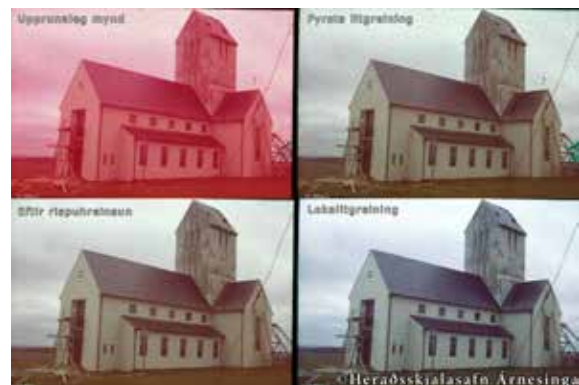
Skálholtskirkja. Upprunaleg mynd efst til vinstri, fyrsta litgreining efst til hægri, rispuhrænsun neðst til vinstri og loka litgreining neðst til hægri.

Mikið hefur verið rætt um aðgengi almennings og sveitarfélaga að ljósmyndum á skjalasafninu. Í samstarfi við Sveitarfélagið Árborg voru hönnuð átta ljósmynda-skilti, 130x150 sm. sem sett voru upp í miðbæ Selfoss og á íþróttasvæði bæjarins fyrir UnglingalandsmótUMFÍ sem fram fór í bænum sumarið 2012. Á skiltunum var brugðið upp svipmyndum úr bæjarlífinu, af Ölfusárbrú, árflóðunum, veiði í ánni, Mjólkurbú Flóamanna, Kaupfélagi Árnesinga og íþróttalífi í bænum.