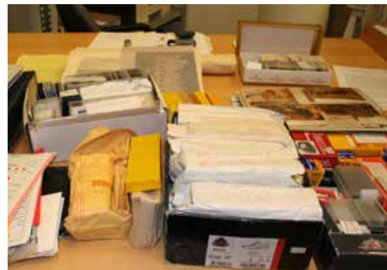
Hluti af ljós-mynda- og filmu-safni Arnórs Karlssonar sem afhent var 2012.

Íslands. Alls voru skráðir 46,97 hillumetrar af skjölum. 30 afhendingar fengu safn-mark 1012/ auk afhendingarnúmers en ekki er vitað hvenær þær bárust safninu. Öll skráning skjala var í samræmi við alþjóðlega staðla ISAD-G og ISAAR, sem eru gefnir út af Alþjóða skjalaráðinu. Staðlarnir taka til skjalaskráningar, upplýsinga um skjalamyndara og þau skjöl sem tilheyrta viðkomandi afhendinganúmeri. Þessar