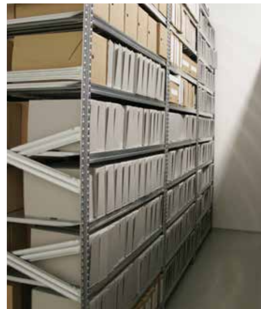
Móttaka, flokkun og skráning á stórum skjalafhendingum batnaði til muna þegar aðstaðan í Háheiði var tekin í notkun. Nú er hægt að taka á móti skjölum á vörubrettum og öll vinna við skráningu verður einfaldari og markvissari. Nú er jöfnum höndum tekið við afhendingum bæði á Austurvegi og í Háheiði.

Nú er búið að skrá skjöl frá 2005 til 2016 samkvæmt stöðlum. Opinber skjöl á þessu tímabili eru alls 250,69 og einkaskjalasöfn 199,55 hillumetrar, samtals 450,24 hillumetrar. Aðfanganúmer eru 971, 64 afhendingar þar fyrir utan hafa fengið aðfanganúmer 1010, 1011 o.s.frv. en þessar afhendingar rötudu ekki inn í aðfangabók á árunum fyrir 2009. Skipulega færð aðfangabók vönduð skjalaskráning og endurskráning eldri afhendinga er lykill að því að gera skjalasafnið betur aðgengilegt og þessari vinnu var og verður haldið áfram samhliða skráningu á þeim skjölum sem berast á hverju ári. Það er ekki hægt að setja tímamörk á þetta verkefni en